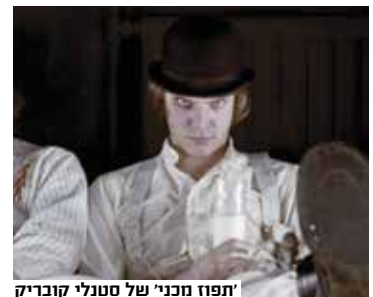
'תפוז מכני' של סטנלי קובריק

יוצא דופן בהצלחתו לחזות את נפילת האימפריה הוא אנדריי אמלריק, אינטלקטואל סובייטי שפרסם ב-1970 את הספר 'האם תמשיך ברית המועצות להתקיים