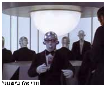
וודי אלן ב'ישנוני'