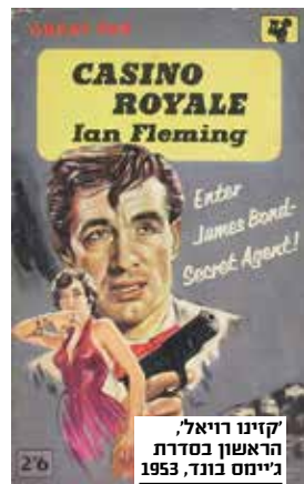
'קייט ויאל', הראשון בסדרת גיימס בונד, 1953