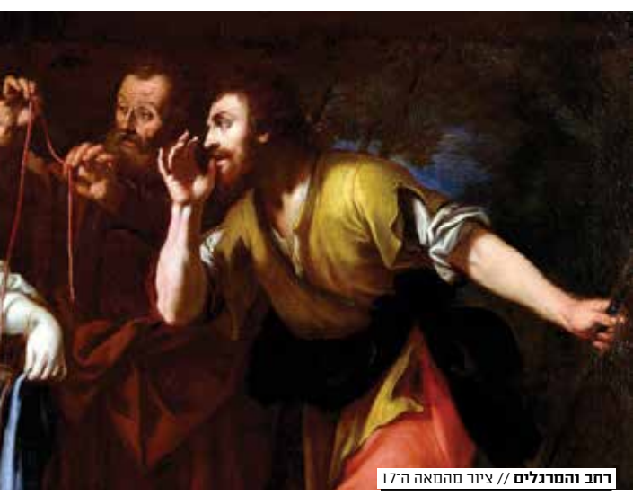
רחב והמרגלים // ציור מהמאה ה-17

אחרת אנשיו היו מצליחים לגלות את תכניתו הדמונית של חמורבי מלך בבל, בן בריתם הבוגדני, לכבוש את מארי ולשוף אותה עד עפר. בשנת 1482 לפני הספירה, בתקופת תחותמס השלישי, בן השושלת ה-18 של מלכי מצרים העתיקה, השתכלל הריגול לכדי אמנות, בסגנון השיטות הנהוגות גם כיום. הייתה זו ראשית ימי שירותי הריגול והביון, שהתבססו במצרים, בסוריה ובארץ כנען, מה שלמעשה הופך את האזור שבו אנו חיים - המזרח התיכון - למרכז ולבירת הביון הקדמוני. תחותמס יצא למסע כיבוש שהגיע לשיאו בקרב מגידו, המספק את דו"ח פעולות הביון הקדום ביותר