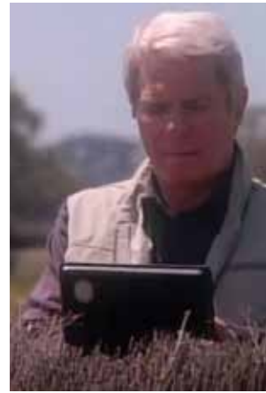
גלגולי 'משימה בלתי אפשרית': סדרת הנקור (משמאל), סדרת ההמשך (למעלה) והגרסה הקולנועית