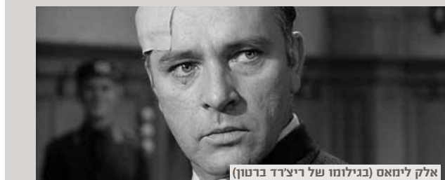
אלק לימאס (בגילום של ריצ'רד ברטון)

ג'יימס בונד סייע לשחרור המיני של שנות ה-60, משום שהיה הגיבור הספרותי הראשון שתואר כמי שמקיים קשרים זמניים עם נערות מכל הסוגים. הוא לא הוצג כטיפוס חשוד ומפוקפק, בוגדני ונהנתן, אלא כמי שעושה זאת מטעמים אידיאולוגיים על מנת להציל את בריטניה ואת העולם כולו