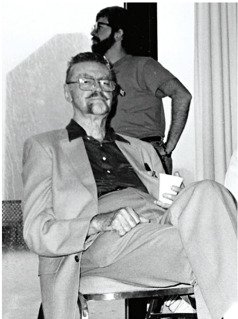
הגרסה הג'יברישית. דה'קאמפ

"כמה מערעורנותו של לאבקראפט נקראים כמעין פיתוח מפורט של רעיונות שאפשר למצוא בספרים האזוטריים ביותר של הקבלה, השבתאות והפרנקיזם", אומר ריבלקה. "קת'ולה, שישן בעיר תתימית